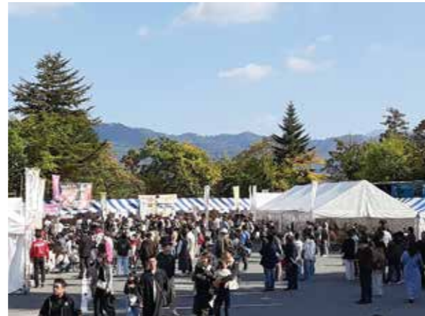
大勢の皆様にお越しいただきました