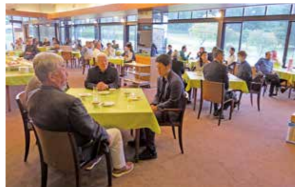
表彰式を兼ねたパーティーの様子