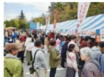
信州サーモン・安曇野林檎ナポリタンPRブース