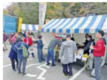
安曇漬物組合ブース