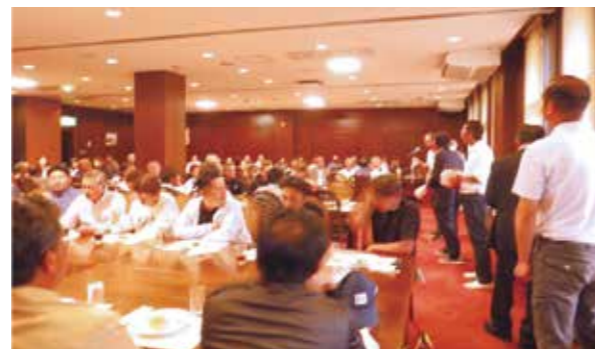
表彰式を兼ねたパーティー