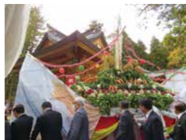
豊稷宝船の曳きまわし