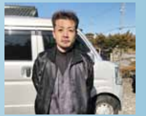
建物のことならお気軽にご相談ください

商工会入会後は建設業部会に加入し、「住まいの安心相談窓口事業」にも登録していますので、リフォームはもちろん、手直しや建具の調整などの細かい工事まで、住宅に関するご相談がありましたらお気軽にお声掛け下さい。