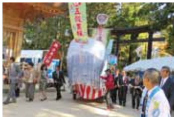
豊穰宝船の曳きまわし