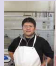
心よりご来店をお待ちしております。