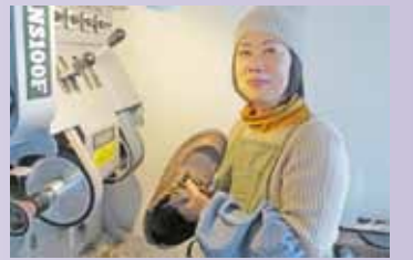
靴についてお気軽にご相談ください