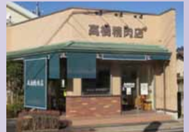
お店はデリシアはちが店の斜め向かいです。