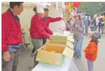
復興支援ブースでのミカン販売