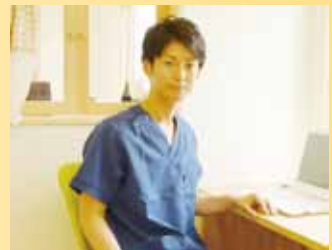
HPは「安曇野にしやま整骨院」で検索下さい。