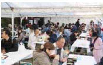
賑わっている飲食ブース