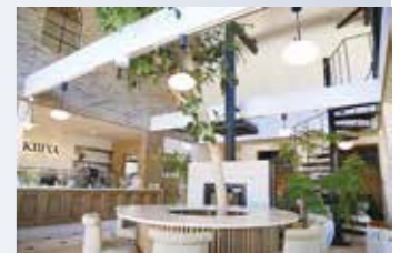
大きい吹き抜けで開放的な店内

宿泊営業時間 チェックイン 15:00 / チェックアウト翌 10:00 定休日 不定休