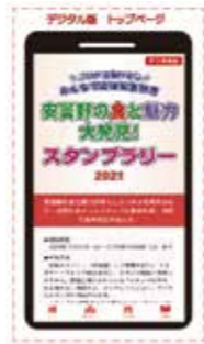
デジタルスタンプラリー（スマートフォン画面）のイメージ