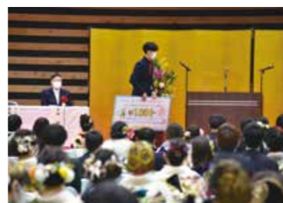
理容・美容・クリーニング振興券贈呈式