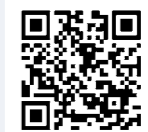
KIIIIYA cafe & hostel Instagram