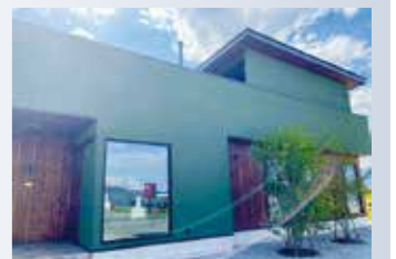
ラーメン大学穂高店向かいの緑色の店舗です

定休日 月曜日・第3日曜日・不定休 営業時間 11:30～14:00L.O. ディナー 金・土曜日のみ 18:00～20:00L.O.