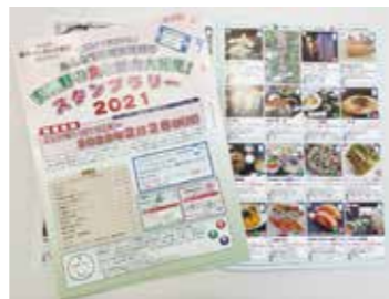
スタンプラリーの冊子

スタンプラリー実施期間は令和3年11月11日から令和4年2月28日まで、その後市内登録宿泊施設で使えるクーポン券や安曇野産品詰合せセット等が当たる抽選会を行って参ります。