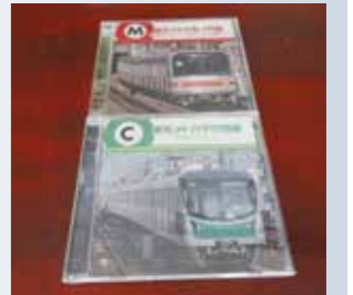
作曲・編曲を手掛けた発車メロディーが収録されているアルバム