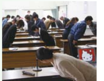
好感度アップの挨拶実技

受講者から事前にアンケートを取り、お客さまからのクレーム対応をどのようにしたらよいか等、今困っていることについて対応策を説明したり、お客様に与える印象を良くするための発声・応対方法について実際に受講者同士で実施しました。セミナー終了後に個別に相談をされる事業所もあり、今回の受講を通して更なる接客サービスの向上を図っていただければ幸いです。(松澤)