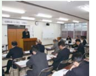
さらなる連携強化を図ります

グローバル化と急激な円高による受注減など先行き不透明な経営環境が続きますが、県の産業振興戦略ビジョンに沿った医療、介護、環境など成長分野のポイントについて学ぶことができました。(金森)