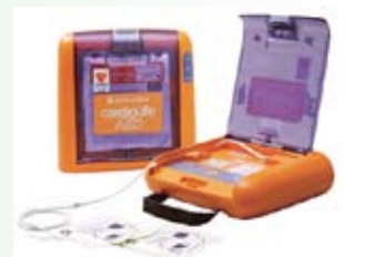
万一の時の知識を習得