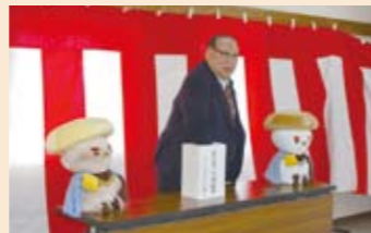
県外からも多くの応募がありました

応募者の県内・外の割合はほぼ半数であり、長野県に次いで多かったのは関東圏、東海圏でした。男女比は女性が多く、年齢層では30代～60代が大半を占めました。(平川)