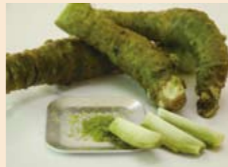
ノベルティでも大活躍

またイベント時のノベルティとしての活用も行い、差別化を図ることができました。今後も同様に普及活動を続けていきますので、積極的なご活用をお願い致します。(金森)