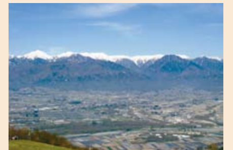
長峰山からの景色は絶景です

晴れ渡ってすばらしい絶景をご覧いただいた方、曇ったり霧がかかっている十分に景色を楽しめなかった方など様々でしたが、ご参加いただいた皆様からは「朝早かったけれど参加してよかった」など多くの方から好評をいただきました。(降幡)