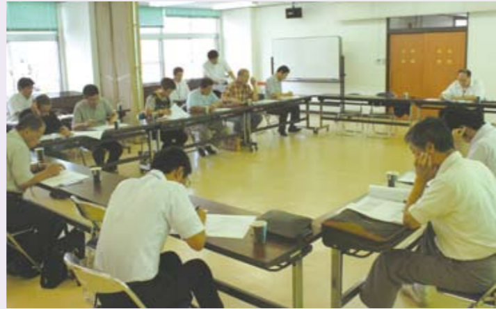
商工会の事業運営のあり方について熱心に討議する委員

今年度事業計画の重点方針である「組織体制の再構築と強化実施」の具体策を検討する会長の諮問機関として、特別委員会を設置しました。平成27年度より、県の補助金の大幅削減と、それに伴う市の補助金の見直し削減が見込まれており、一方で平成24年度は任期満了に伴う役員の改選や総代の改選が行われます。合併後5年を経過し、商工会の事業運営の基本と将来にも及ぶ大きな分岐点を迎える中で、最初に組織の在り方について、「役員選任規程の見直し」を提案し委員会で協議、意見を取りまとめて会長に答申をしました。詳細については、別号で会員の皆様にお知らせします。(花岡)