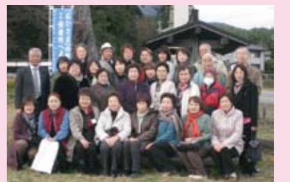
吉岡町商工会女性部の皆さんと

11月24日(木)群馬県吉岡町商工会女性部員19名が、「信州お出かけ食ベルート」事業を中心に、当商工会女性部が取り組んでいる地域振興事業の視察にお見えになりました。当女性部10名の役員様と約1時間懇談を行い、その後堀金岩原地区のそば畑の口ケ地を見学されました。